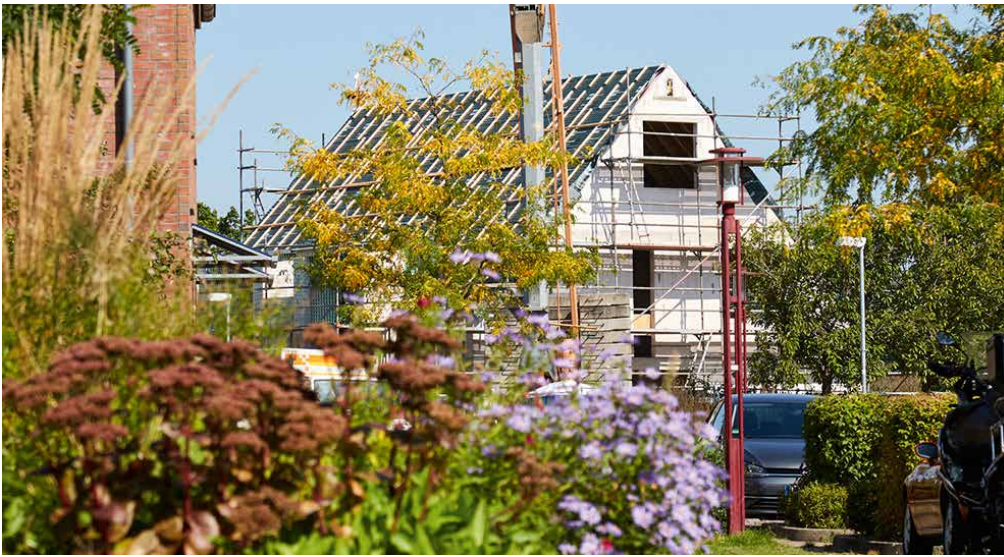
Gedeckt wird das Dach mit Betondachsteinen von Braas in Schiefergrau oder Granit