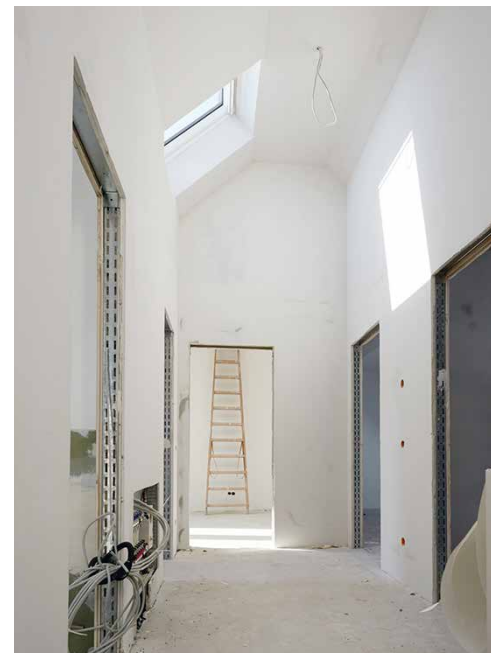
Der Flur in der ersten Etage: drei Zimmer, zwei Bäder

Während im Haupthaus noch kräftig gearbeitet wird, glänzt das individuelle Hofhaus mit seiner Fassade schon in der Sonne. Die neuen Eigentümer des zurückgelegenen Domizils können sich auf eine ungewöhnliche Architektur, mehr als 150 m 2 Wohnfläche und eine luxuriöse Ausstattung freuen: Wohn- und Schlafräume sowie Flure werden mit »Landhausdiele Eiche« ausgelegt. Küche und weitere Räume erhalten Böden aus Feinsteinzeugfliesen.