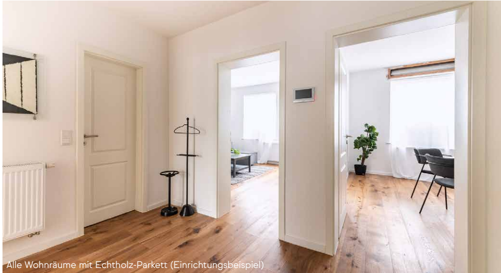
Alle Wohnräume mit Echtholz-Parkett (Einrichtungsbeispiel)

Mönchengladbach ist mit 261.000 Einwohnern die größte Stadt am linken Niederrhein. Mehr als 1000 Jahre Stadtgeschichte haben eindrucksvolle Spuren hinterlassen: Wunderbare Altbauten und pittoreske Marktplätze laden zum Schlendern und Verweilen ein. Ebenso hat Mönchengladbach für Kultur- und Naturliebhaber angenehme Überraschungen zu bieten.