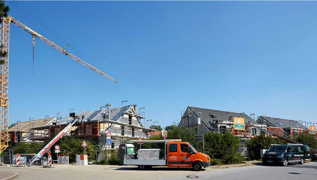
Der Rohbau für acht gut geschnittene Doppelhaushälften steht

Die Baustelle an der Zeppenheimer Straße präsentiert sich in markanten Dimensionen. Hier sehen acht großzügige Doppelhaushälften mit einladendem Grün vor und hinter dem Haus ihrer Fertigstellung entgegen.