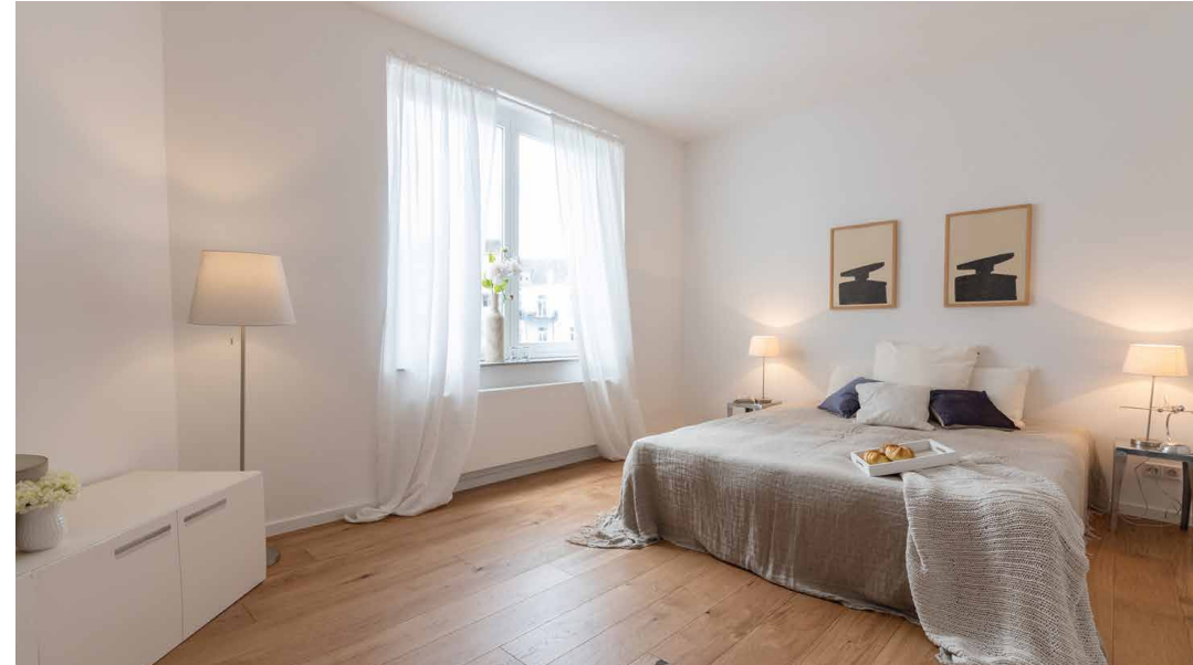
In diesen großzügigen Räumen lassen sich viele individuelle Wohnideen realisieren