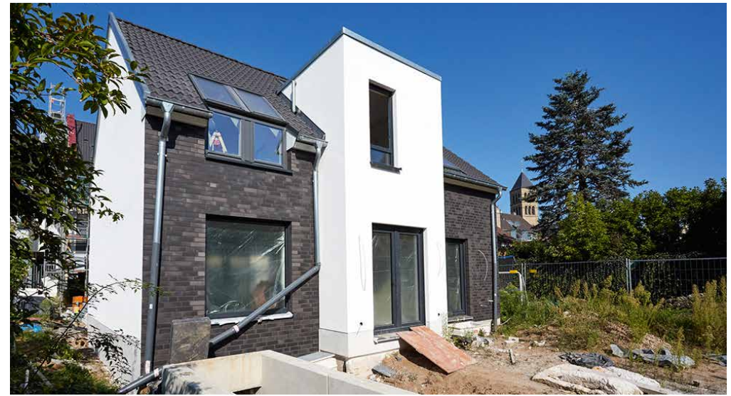
Terrassen vor und hinter dem Haus schaffen im Sommer zusätzlichen Lebensraum

Sollte es die Bewohner dieses schönen Fleckchens einmal in die Stadt ziehen, lässt sich Düsseldorf über die A44 oder die A52 nach kurzer Fahrt erreichen.